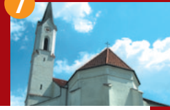
7 Marktl am Inn

Kath. Kirche St. Nikolaus Romanischer, verputzter Tuffquaderbau 12./13. Jh., im 15. Jh. gotisiert, Rokokoaltar 18. Jh.