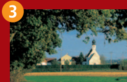
3 St. Johann

Weitere Sehenswürdigkeiten in Neuötting: Historischer Stadtplatz in typischer Inn-Salzach-Bauweise mit Landshuter und Burghäuser Tor, Stadtmuseum und Tourist-Info im historischen Kastenhaus des Klosters Baumburg